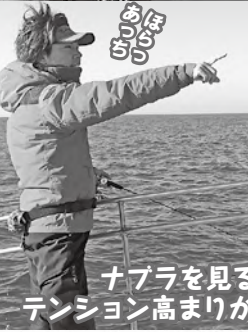
ナブラを見ると テンション高まりがち