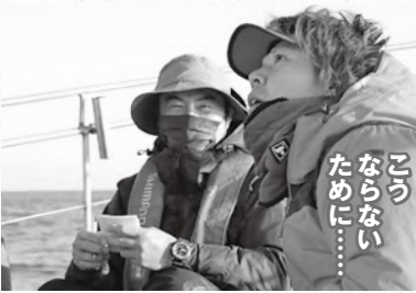
▲高切れたラインを見て、ドラッグ調整について解説を始める

「マハタッ!? 違うか」「マハタきたッ!? 違うか」を延々と繰り返すヨッシー。沖揚がりの