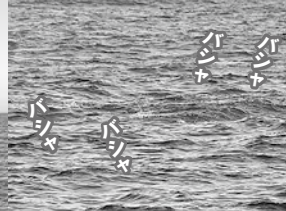
●ナブラ、トリヤマ、跳ね。沖でこの三つに遭遇したルアーマンの心拍数は急上昇。当日はナブラに遭遇して狙ったものだれもヒットせず、正体も分からなかった