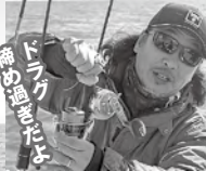
●ドラッグ調整を忘れたときに限って突然の大物がヒット! ドラグがガチガチに締まっていて痛恨のラインブレイク

●青物のボディにサメのかみ跡がくつきり付いている。ファイトが長引くとサメに襲われる可能性が高くなるので気を付けよう