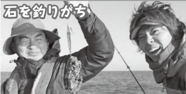
▲根魚がよく釣れる場所は底にある石なども引っ掛かりやすい