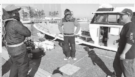
▲タカハシゴーが掛けた大物長が不明について話を弾む

「マハタッ!? 違うか」「マハタきたッ!? 違うか」を延々と繰り返すヨッシー。沖揚がりの