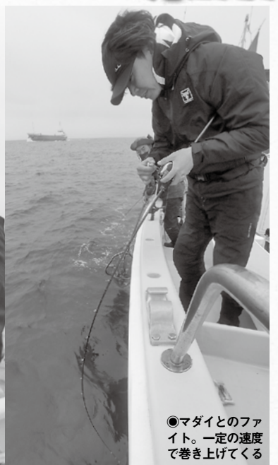
●マダイとのファイト。一定の速度で巻き上げてくる