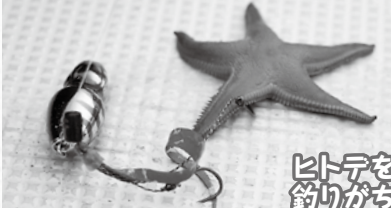
ヒトデを釣りがち

▲着底して即、巻き上げてもしっかり掛かってくるヒトデ。当日はほかに海藻などもよく掛かってきた