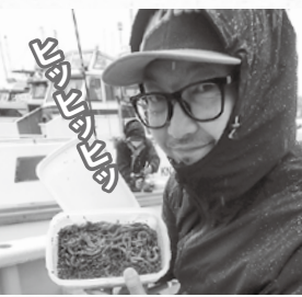
▲オレンジイソメをネクタイ代わりにするイソマン鹿島