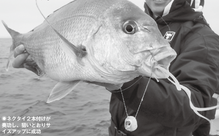
●ネクタイ2本付けが奏功し、狙いどおりサイズアップに成功

今度はサイズアップを狙おうかな。やり方は色いろあるけど、ネクタイをボリュームアップしてみよう。