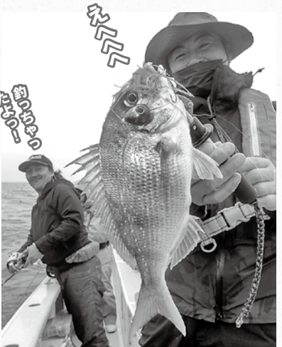
▲ピンクのネクタイ&ラバーをチョイス

の2本バリは段差ありの仕様。食いが浅くてもどこかには掛かってくるね」と段差バリの効能を確認した。