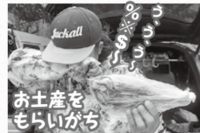
お土産をもらいがち