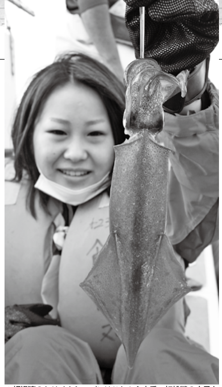
▲相模湾のヤリイカシーズンはこれから本番。初挑戦の女子も食べごろサイズをキャッチ

ろで釣りに参加し2連続でヤリイカを釣り上げる。しかし3杯目を乗せたところでギューンと竿が引き込まれ、バツンと仕掛けごと持っていかれてしまう。 船長の話ではおそらく大型のマダイの仕業とのこと。ちなみに同船では、混雑していない日は四隅の釣り座でハモノ狙いのヤリイカ泳がせもできるらしい。その後は乗りが遠のき13時半に沖揚がり。 当日は潮具合が気に入らなかつたのか乗り渋り、釣果はトップ10杯で平均7~8杯ほどと奮わなかつたが、ヤリイカの本格シーズンはこれから潮次第で大釣りも期待できるので釣行してみたいかがだろ。