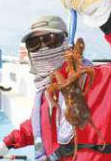
▲このサイズが多かった ▶小型はスパッと抜き上げよう