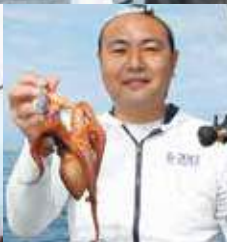
▲300グラム以下はリリースを推奨 ▼今後のサイズアップに期待