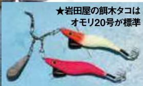
★岩田屋の餌木タコはオモリ20号が標準

東京湾奥のマダコ釣りが6月1日にスタート。気になる今年の開幕模様を探ろうと、浦安の岩田屋より出船した。初日のため川崎〜羽田沖のほか姉ヶ崎沖など各ポイントを回った。サイズは最大2キロが上がったものの、平均すれば初めから300〜400グラム前後の小型が多かった。 この日の結果だけで手応え十分とは言えないものの、今年も確実に湾奥にタコは湧いていることは確認できた。7月になればポイントも広がるので、盛大な夏祭りが開始されることを期待したい。 (詳細は50ページ参照)