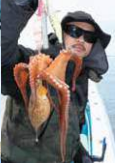
◀トップはダントツも平均すれば2~3杯 ▼スシツとした重量感が楽しい