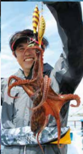
▲近年のブームを受けてほとんどの人が竿釣り ◀手釣りも便乗OKで、最大2キロをゲット