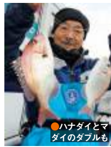
●ハナダイとマダイのダブルも