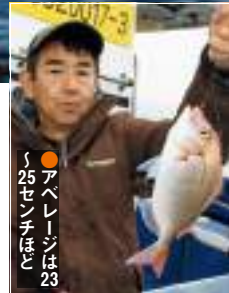
●アベレージは23センチほど