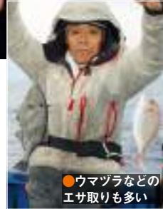
●ウマヅラなどのエサ取りも多い