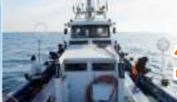
▲釣り場は飯岡沖の水深30メートル前後