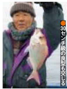
●30センチ級の良型も交じる