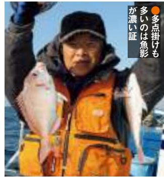
●多点掛けも多いのは魚影が濃い証