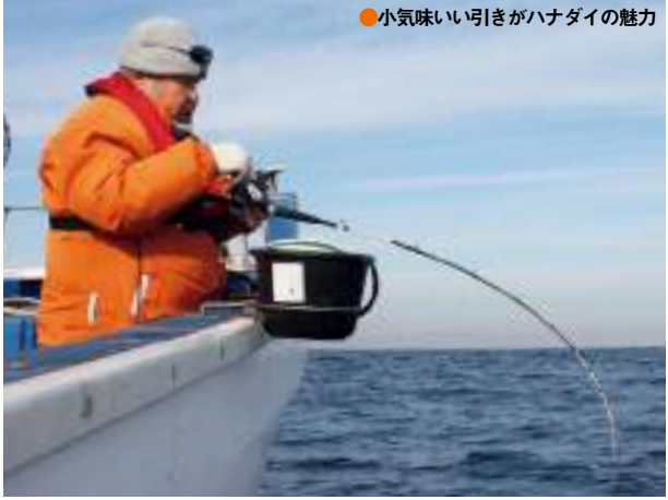
●小気味いい引きがハナダイの魅力