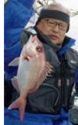
▲マダイもたまに交じる ▼4本バリにパーフェクト