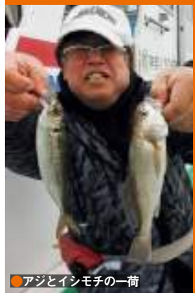
●アジとイシモチの一荷