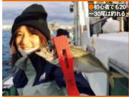
●初心者でも20～30尾は釣れる