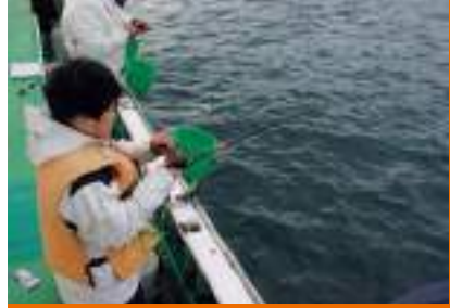
▲大人から子供まで、だれでも楽しめるのがいい