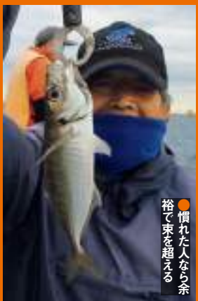
●慣れた人なら余裕で束を越える