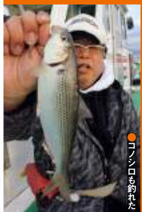
●コノシロも釣れた