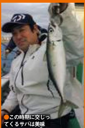
●この時期に交じってくるサバは美味