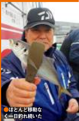
●ほとんど移動なく一日釣れ続いた