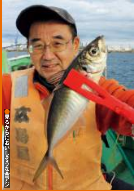
●20センチ前後が多い