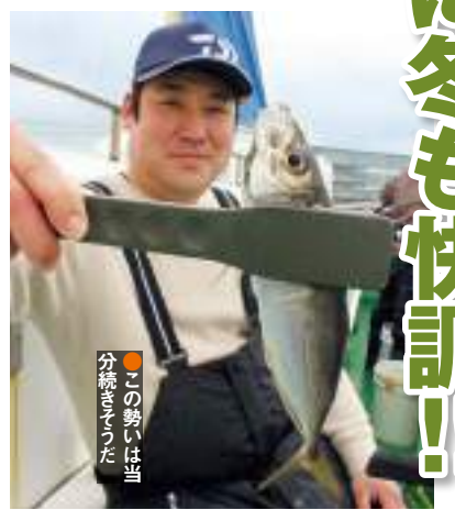
●この勢いは当分続きそう