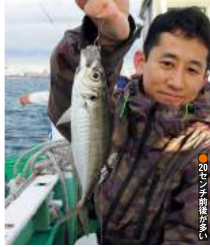
●20センチ前後が多い