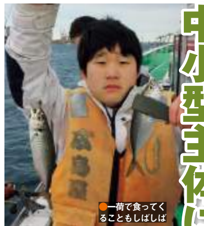
●一荷で食って帰ることもしばしば