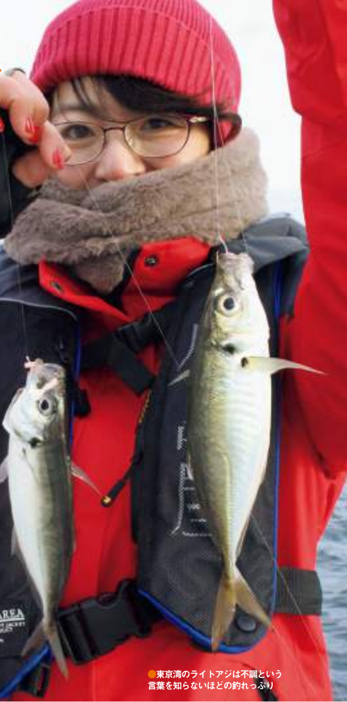
●東京湾のライトアジは不調という言葉を知らないほどの釣れっぷり