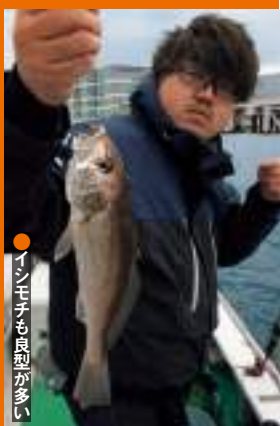
●イシモチも良型が多い