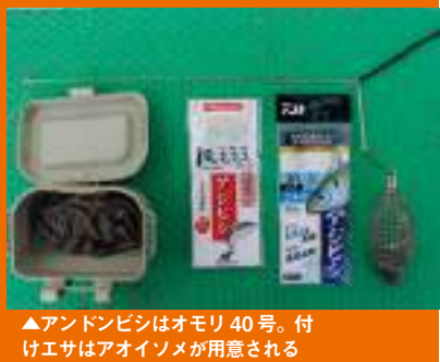
▲アンドロピシはオモリ40号。付けエサはアオイソメが用意される