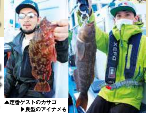
▲定番ゲストのカサゴ ▶良型のアイナメも