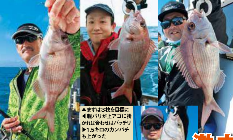
▲まずは3枚を目標に ◀親バリが上アゴに掛 ければ合わせはバッチリ ▶1.5キロのカンパチ も上がった