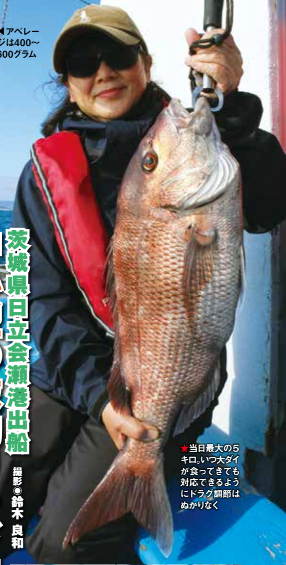
★当日最大の5 キロ。いつ大ダイ が食ってきても 対応できるように ドラグ調節は ぬかりなく