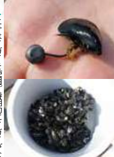
▲エサはイガイを用い、定期的にイガイがなくなる小さなカニを使う。

横浜本牧に店舗を構えるシーウルフが釣具店としてオープンしたのは今から22年前のこと。本牧周辺といえば昔からクロダイを筆頭にアイナメやシーバスの魚影が濃いエリアだが、現在