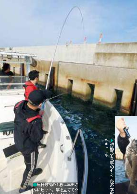
●当日は全長4.5メートルのノベ竿を用いた前打ちで狙った