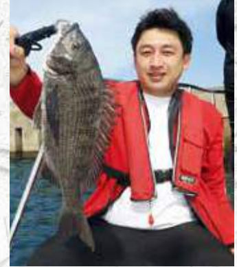
▲45センチ級の見事なクロダイ