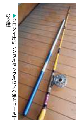
▶クロダイ用のレンタルタックルはノベ竿とリール竿