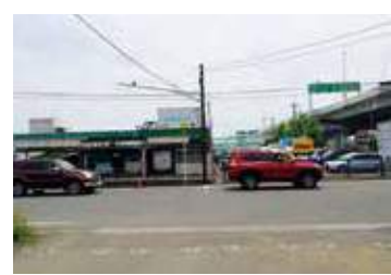
▲車は乗船場に隣接するコインパーキングに停める。(一日700円)