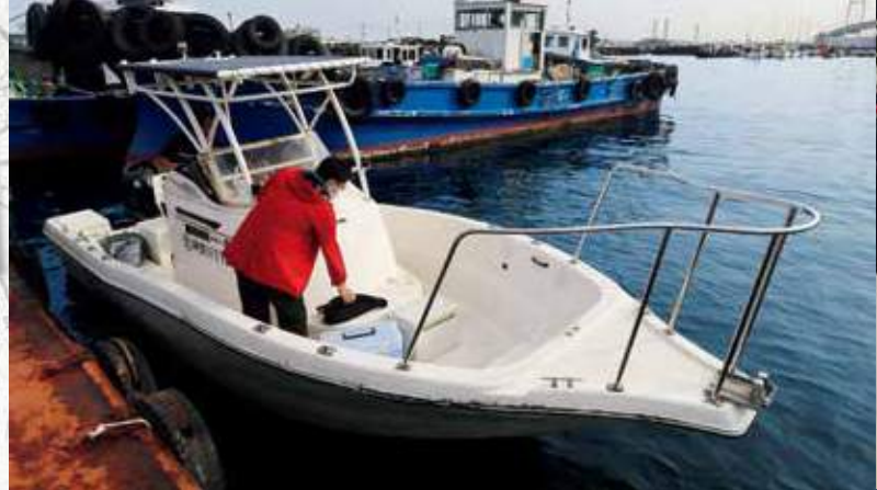
▲小型のボートで出船。船内にはトイレがあるので女性も安心

●通常コースは4時間で3万円。ダブルコースは8時間で6万円。一日コースは10時間で7万5000円。いずれのコースも定員は3名(3名以上は1人増すごとに1万円)。シングルコース(1人でチャーター)は4時間2万円。