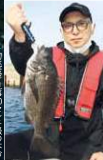
▶初挑戦で見事40センチ級の本命をキャッチ