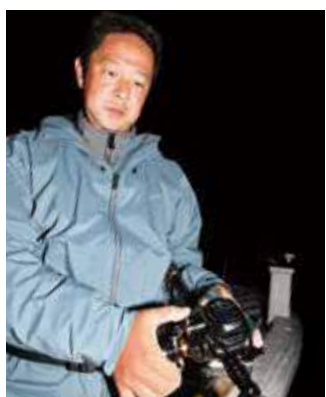
▲パーミングしやすいコンパクトボディが手巻きリールに引けを取らない操作性を生む

たM245、MH245の3アイテム。本体はしなやかなUDグラスをスパイラルXコアで締め上げたブランクスを採用した6:4調子で、食い込みのよさと、魚の引きや船の上下動に追従してバラシを防ぐ粘り強さを持つ。 「今日はショートタイプのM210で釣っていますが、魚が掛かったときにしっかりと竿が曲がり込んでくれて、徹底的にバラシを抑えてくれます。また、置き竿で狙う方も安心ですね。 ムツは斜面のポイントを狙うことも多い釣りですが、そんなときはビーストマスター2000に搭載された魚探画像が表示される探見丸スクリーンが便利です。」 この機能は、リールが探見丸の親機の電波をキャッチし、カラー液晶画面に水深、海底形状、魚群の反応や魚体長などが表示