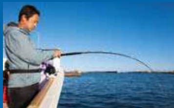
▲M210にオモリ150号をセットした曲がり。当日は潮が速かったためオモリ200号を使用した