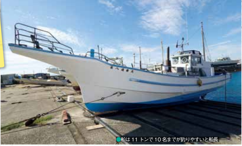
●船は11トンで10名までが釣りやすいと船長

●カワハギやアオリイカなど近場の釣り物は5名まで4万2500円。1人増し8500円。アマダイやオニカサゴ、マダイ五目などは5名まで4万5000円。1人増し9000円。キハダやカツオは電話にて確認。下船後に船宿にて精算。