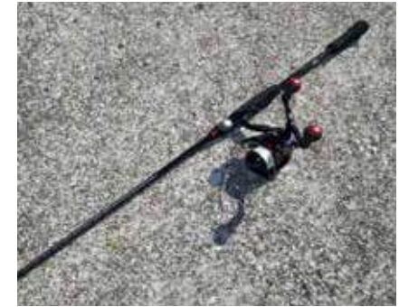
▲ティップランエギング用のレンタルタックルは3セット用意されている