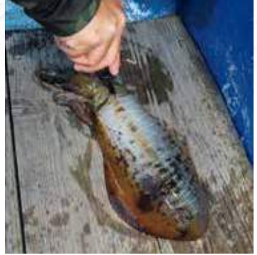
▲アオリイカは絞めて持ち帰るとよりおいしくいただける