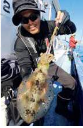
▶今期の長井沖のアオリイカは良型が多い