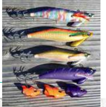
▲ティップランエギング用の餌木は3.5号25～30グラム。5～20グラムのヘッドシンカーも用意して状況に対応しよう

しかし10時を過ぎて潮が止まってしまふとアタリが遠のき、しばらく沈黙の時間が続く。「潮が動き出すまで辛抱ですね」と小林さん。