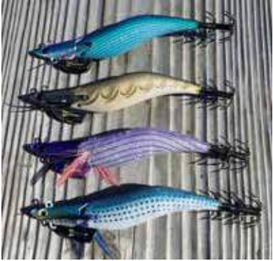
▲船長のおすすめカラーはこの4色