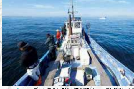
▲ティップランエギングは片舷に並びドテラ流しで狙うため5～6名が釣りやすい