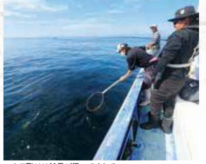
▲タモ取りは船長が行ってくれる