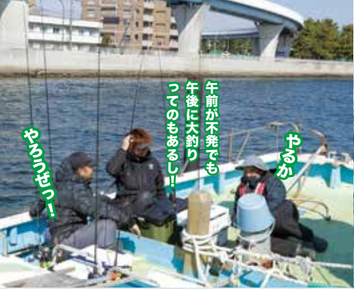
▲午後船に乗り込み作戦会議