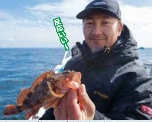
▲午後からの下げ潮ではカサコの活性が上がり連発