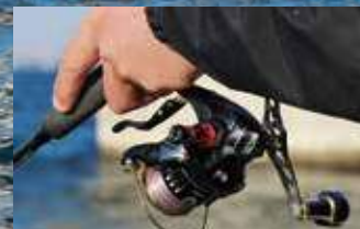
▲50センチ刻みで巻き上げて底上5メートルまで探る