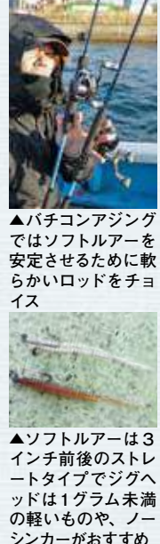
▲バチコンアジングではソフトルアーを安定させるために軟らかいロッドをチョイス ▲ソフトルアーは3インチ前後のストレートタイプでジグヘッドは1グラム未満の軽いものや、ノーシンカーがおすすめ