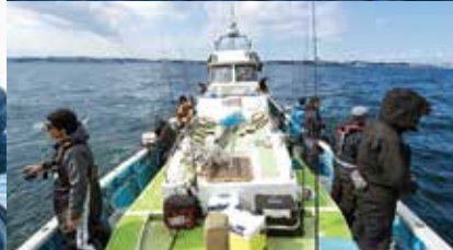
▲当日の釣り場は八景沖の水深25~30メートル前後