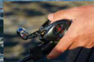
▲いつでも即合わせできるように構えておく