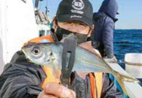
▲当日はアジのタナが目まぐるしく変わり、うまく対応できるとのこと