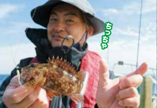
▲オモリを底に着けてアタリを待つとカサコがヒット