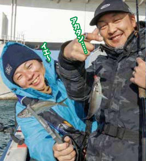
▲本牧沖ではエサ釣りで20センチ前後のアジがよく釣れた