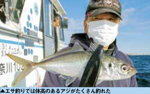
▲エサ釣りでは体高のあるアジがたくさん釣れた