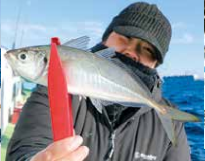
▲シケ後の影響で食いが渋かったものの、潮が動き出すとアタリが増えてきた