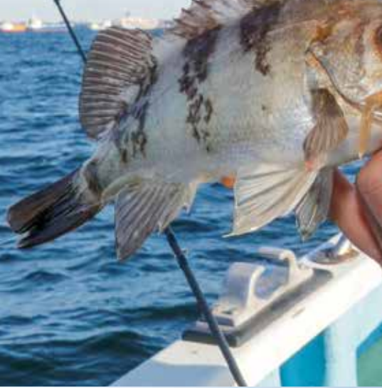
▲午後船の終盤、本牧沖の水深20メートル前後のポイントへ移動し、ラストチャンスにける