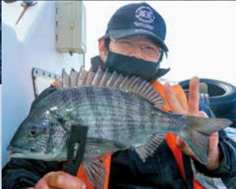
▲八景沖から見える富士山のパノラマを楽しみながら釣りが楽しめる ▶エサ釣りでクロダイが交った ◀アカタンでメバルも釣れた